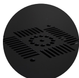
Ventanillas de ventilación